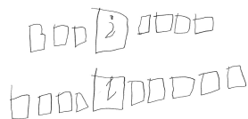
Figura 2: Entrevista A1

pedras que entraban a la izquierda, el cambio lo representó con una interrogación en un cuadrado y a la derecha los elementos que salían de la caja (ver figura 2).