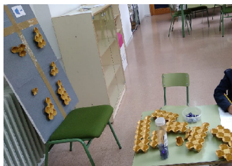
Figura 1: Entrevista individual y materiales utilizados

Para que los alumnos observasen el cambio, se introducían en la máquina piedras lunares y, dentro de la máquina, la investigadora le añadía dos piedras lunares. Pedíamos a los alumnos que explicaran lo que observaban y que representaran en una tabla la información obtenida, para ello utilizamos el franelograma con columnas y encabezados y hueveras. Así, emergieron parejas de datos. Por ejemplo, entra una piedra y salen 3 piedras. Utilizamos números menores que 10, por ser con los que estaban familiarizados y se les plantearon en orden no consecutivo para evitar la recurrencia. Por último, dimos a los alumnos un folio para que describieran qué pasó en la sesión.