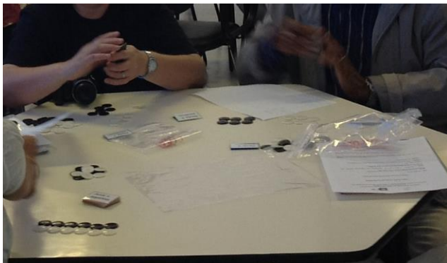
Figura 2. Professores participando do jogo.

No curso de formação, cada grupo de professores receberam um conjunto de fichas e cartões. As fichas, no caso, eram botões brancos representando as quantidades positivas e os botões pretos, as negativas. Depois de receberem as instruções, os professores participaram do jogo.