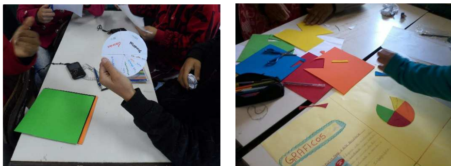
Figura 2. Construção do gráfico de setores com EVA.

O gráfico de setores foi construído pelos estudantes primeiramente em folhas de ofício que serviam como molde para que o fizessem em EVA colorido e colassem no cartaz. Nesse momento foram trabalhados conceitos e procedimentos como porcentagem, razão, proporção, ângulo, cálculos, regra de três, perímetro, raio, entre outros. Conforme PCN a abordagem do bloco Tratamento da Informação,