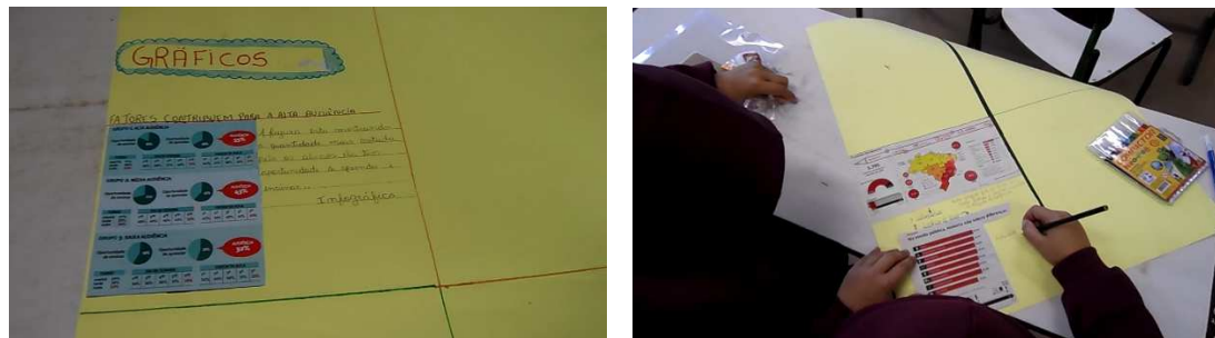
Figura 1. Atividade de pesquisa em revistas e jornais.

identificação de tabelas e gráficos e a interpretação da informação apresentada por estes. Com os estudantes organizados em duplas ou trios, foram distribuídos jornais e revistas de modo que pudessem pesquisar gráficos e tabelas com informações que julgassem relevantes. Com o material selecionado foi confeccionado cartazes (Figura 1) que incluíam também as interpretações dos estudantes sobre as informações contidas nos gráficos e tabelas. Cada grupo realizou uma breve apresentação de sua pesquisa para a turma. Buscou-se com isso além de proporcionar aos estudantes o reconhecimento da forma de organizar e apresentar dados, o trabalho coletivo, a síntese e socialização das informações.