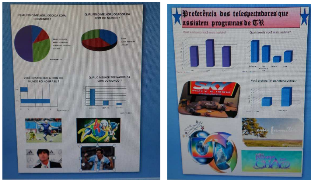
Figura 4. Cartazes das pesquisas sobre os temas selecionados pelos estudantes.