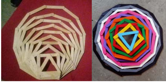
Imagen 1.6 Figuras realizadas