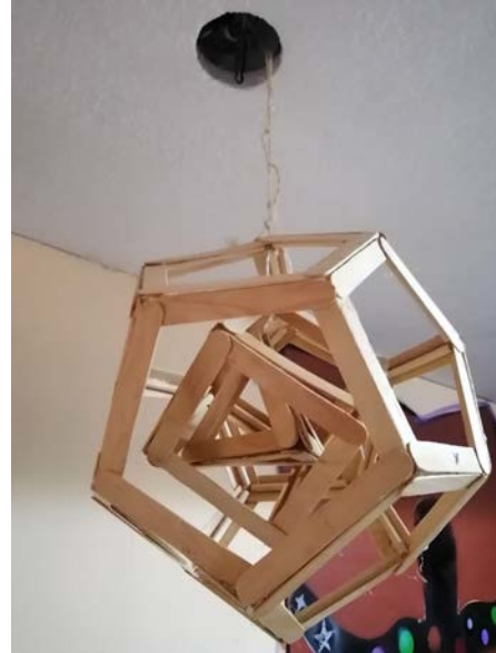
Imagen 1.9 Producto final