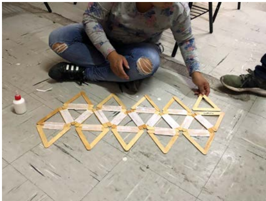
Imagen 1.8 Realización de figuras tridimensionales