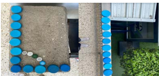
Imagen 1.1 identificación de líneas en el entorno