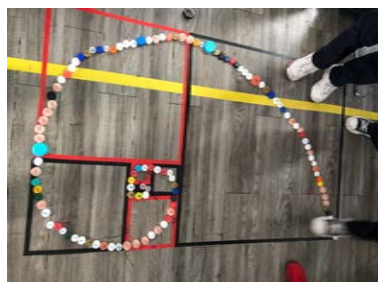
Imagen 1.3 Secuencia Fibonacci