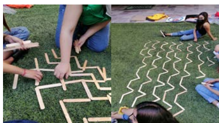
Imagen 1.2 Sucesión de líneas