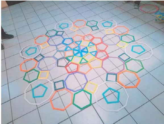
Imagen 1.7 Mándalas realizados mediante las figuras