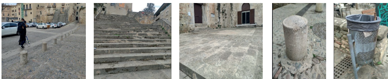
Figura 1. Fotografías que muestran los objetos referidos en la actividad.

La actividad consistía en un cuestionario con preguntas de respuesta abierta para ser resuelto por grupos de cuatro estudiantes y por escrito (18 grupos en total). Se pidió a los estudiantes justificar por escrito cada procedimiento y las dificultades presentadas durante la realización de la actividad. Los alumnos debían realizar en un primero momento distintas estimaciones de magnitudes de la plaza de delante la facultad (como se puede ver en la figura 1: longitud de la plaza, altura de las escaleras, área de la superficie de la plaza, volumen de una pizona, capacidad de una papelera y temperatura). Seguidamente, debían hacer las mediciones utilizando instrumentos de medida y/o haciendo cálculos a partir de fórmulas. Se debían justificar los resultados de cada pregunta con base a los procedimientos utilizados. Los estudiantes tenían a su disposición distintos instrumentos de medición (reglas, metros, cuerdas, varios metros cuadrados en papel, botella de agua de 1 l y 6 l, termómetro y un odómetro de rueda) a fin de que los utilizaran en la segunda parte de la forma que estimaran conveniente. También se les pedía redondear los resultados y calcular los errores relativos cometidos en sus estimaciones. La actividad duró una hora y media por cada grupo. Posteriormente, a la siguiente sesión con los alumnos, se llevó a cabo un análisis, reflexión y valoración conjunta de las tareas realizadas.