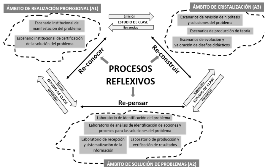
Figura 2. Sistema de interacción para la reflexión desde el desarrollo profesional del profesor.

Ámbito de realización profesional (A1). Ámbito en el que toma forma la práctica de su ejercicio profesional de enseñanza y es fuente de aprendizaje desde escenarios institucionales en los que se manifiestan situaciones problemáticas y a la vez se certifican posibles soluciones. Desde este ámbito se hace nicho al Reconocer . Se reflexiona con el fin de ampliar el significado de lo que sucede, ampliar una mirada al nos-otros (identidad/alteridad) lo que podría favorecer el “entendernos mejor como personas y al mismo tiempo abrimos el camino para comunicarnos con el resto de nuestros semejantes, encontrar respuestas a nuestras inquietudes, nuestros deseos y necesidades” (Arboleda, 2015, p. 631).