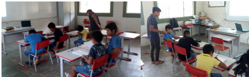
Figura 5: Professor auxiliando os alunos na compreensão dos conceitos matemáticos