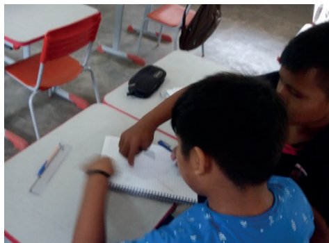
Figura 7: Aluno ajudando ao colega

Em nossas observações em sala de aula vimos, também, que os alunos se ajudavam mutuamente (Figura 7). Aquele que entendia mais rapidamente o que era exposto ou proposto pelo professor, auxiliava o colega para que alcançasse a resposta satisfatória da tarefa.