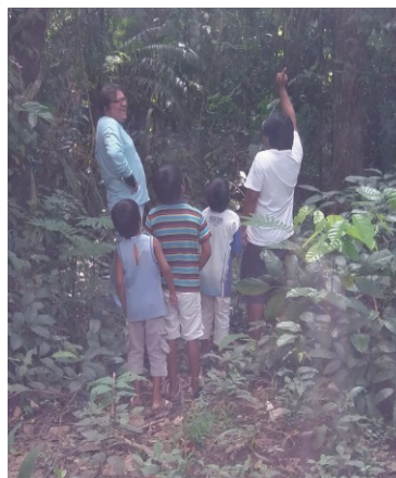
Figura 2: Indígena ensinando sobre a castanheira no meio da floresta (Educação indígena)

A educação escolar indígena integrada à educação indígena permite a preservação da cultura e do ambiente, possibilitando uma aprendizagem significativa (Ausubel, 2000). A educação indígena (Figura 2) sempre existiu e não depende de escola, já que a todo momento ocorre o ensinamento para aqueles que querem aprender. Basta que os mais jovens se aproximem dos sabedores anciãos e que estes estejam desenvolvendo um instrumento, um artesanato, uma cestaria, ou mesmo falando sobre algo, que haverá ensino. É o que chamamos de educação informal. Podemos perceber que nesses ensinamentos há uma matemática própria da etnia e do cotidiano.