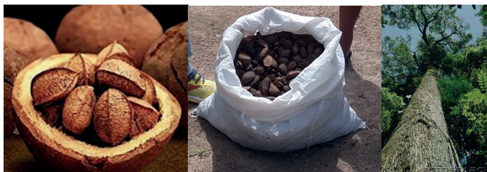
Figura 3: Castanha-da-Amazônia e castanheira

A castanha-da-Amazônica (Figura 3) é considerada produto florestal não madeiráveis (PFNM), sendo um recurso viável à sustentabilidade local, já que não há necessidade de destruir a matéria prima, que é a castanheira. Para Machado (2008, p. 13) “os PFNM são todos os produtos provenientes da floresta e que não sejam madeira, [...]”. No estado de Rondônia, Brasil, que é o quarto maior produtor de castanha-da-Amazônia, a extração está concentrada em terras indígenas (TI). Uma dessas TI é a Sete de Setembro com aldeias localizadas na cidade de Cacoal, no estado de Rondônia e na cidade de Rondolândia no estado do Mato Grosso, em que a coleta era feita, mesmo antes do contato, por todas as famílias da aldeia. Assim, o extrativismo tradicional consiste na coleta dos ouriços que estão no chão, sendo amontoados e posteriormente guardados em cestos.