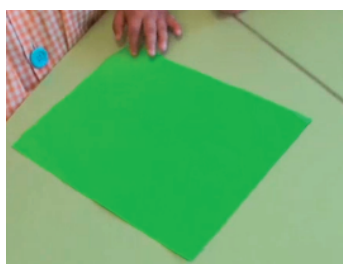
Figura 1. Hilera de círculos

15. P1: R, ¿ya tienes tu cilindro? A ver.