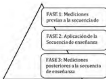
Figura 1: Elaboración propia. Fases tomadas de García-Cabrero, B. (2002).

Para lograr el cumplimiento de los objetivos propuestos se proponen tres etapas en donde se aplicarán técnicas de recolección (la observación participante, la entrevista semi-estructurada y el grupo focal). Además, se realizará un proceso de recolección de información sistemático y con un orden establecido que permitirá (en el proceso de análisis) crear conjeturas válidas y confiables.