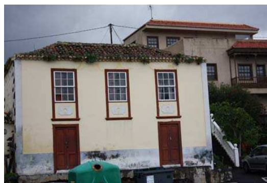
Figura 6. Edificaciones de la isla de La Palma