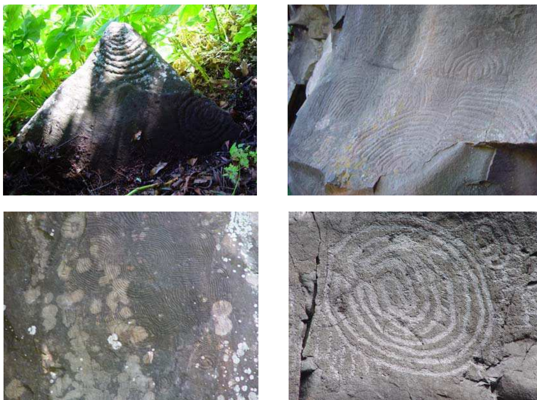
Figura 2. Grabados rupestres de la isla de La Palma

La trashumancia desde las zonas bajas a las cumbres de los montes en busca de pastos para el ganado en la época estival, el sacrificio de los animales machos reproductores después de dos o tres años, para evitar la consanguinidad, la presencia de numerosas aras, como lugares de sacrificio animal en ofrenda a los dioses, que seguramente tiene que ver con las rogativas o agradecimientos en función del devenir de la generosidad de la naturaleza de la que eran totalmente dependientes, nos hace pensar que, seguramente, conocían algún medio para medir el tiempo con cierta precisión. El cambio de los astros y las estaciones es el medio del que se han valido los pueblos primitivos para medir el transcurrir del tiempo, y los benahoaritas, posiblemente, también: el día, por la luz solar; el mes, por la luna; el año, por los cambios de estación climatológica.