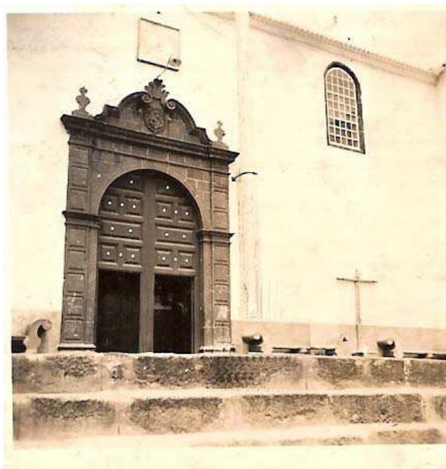
Figura 7. Reloj de sol de la Iglesia de San Francisco

En la reconstrucción de la ciudad, después del saqueo al que fue sometida en 1553 por un grupo de piratas franceses, al mando de Pata de Palo, se hace mención a la instalación de un reloj en la torre de la iglesia del Salvador, traído desde Flandes, en sustitución del que habían quemado aquellos en el saqueo. Este reloj, con toda seguridad era mecánico, pues en Europa ya se comenzaron a fabricar a principios del siglo XIV. Aunque hoy resulte extraño, con anterioridad a la introducción del reloj mecánico, las horas eran desiguales en duración. La razón se debía a la diferente duración del día y la noche a lo largo del año, pues los días son más cortos en invierno que en verano, y, dado que, la mayoría de las civilizaciones optaron por asignar igual número de horas al día y la noche (12), los relojes de sol que se construían lo hacían tomando como referencias las sombras de un gnomon (palo vertical) a la salida, a la puesta y al mediodía del sol. Luego dibujaban 12 líneas equidistantes. Obviamente, el tiempo real para recorrer los 15^\circ entre dos líneas no es igual en los días de verano que en los de invierno.