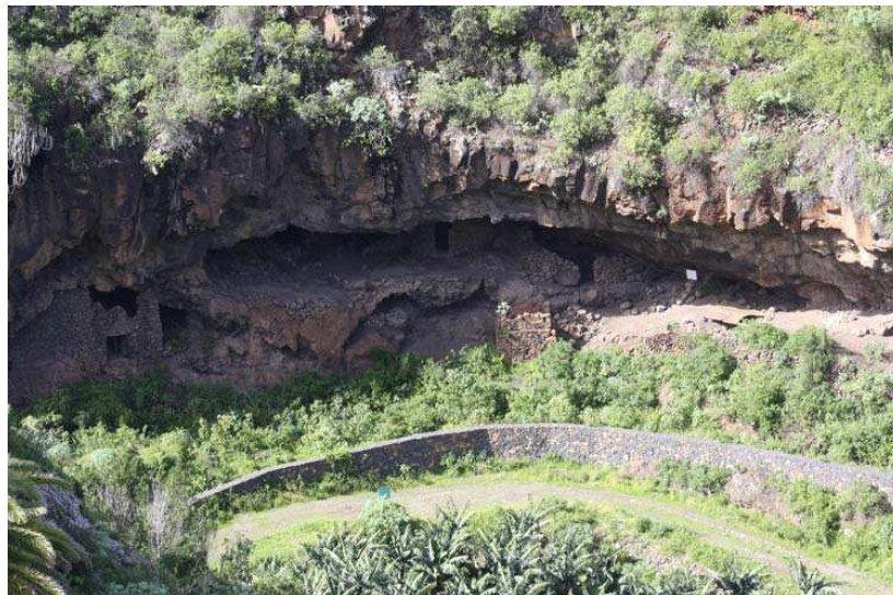
Figura 3. Cuevas del Tendal (La Palma)

un meticuloso reconocimiento y recuento de los restos óseos de los animales que servían de alimento a los benahoaritas. Aquí la estadística juega un importante papel, que los arqueólogos no han dudado en aprovechar. Así en las excavaciones llevadas a cabo en las cuevas del Tendal (figura 3), en el norte de la isla, este procedimiento ha tenido su aplicación tal como lo confirma el arqueólogo Jorge Pais Pais.