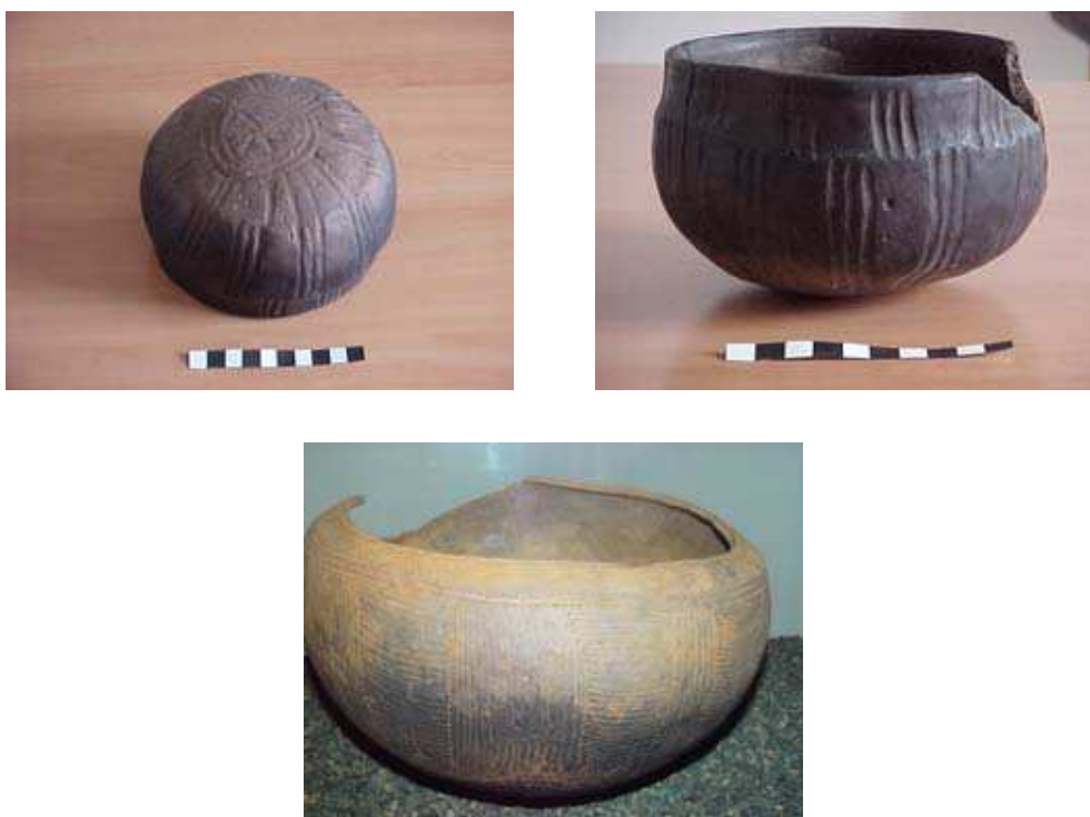
Figura 1. Vasijas de los aborígenes de la isla de La Palma

Para la recogida y almacenaje de productos, fabricaban diferentes tipos de vasijas por el procedimiento del urdido, dado que desconocían el torno. La forma de los cuencos es variada: esférica, semiesférica, troncocónica y cilíndrica, con decoración acanalada o en relieve formando con frecuencia temas curvos como semicírculos concéntricos. Algunas de estas características podemos observar en la figura 1.