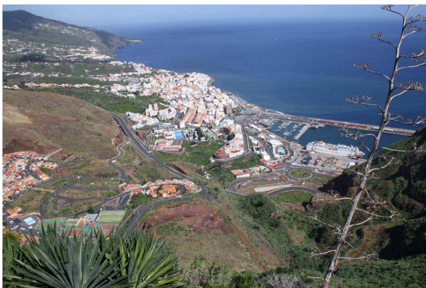
Figura 4. Santa Cruz de La Palma

El poblamiento que se realiza en la Isla, con la arribada de los conquistadores, supuso un salto cualitativo importante en el uso de elementos matemáticos, imprescindibles para el desarrollo de una sociedad mucho más avanzada que la aborigen.