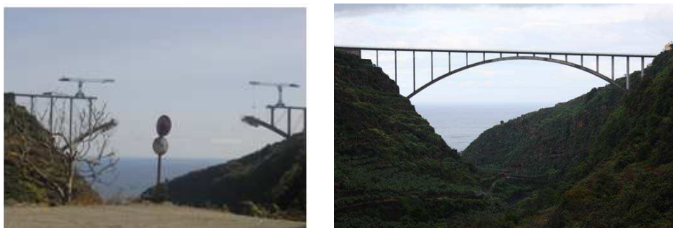
Figura 11. Puente Los Tilos (La Palma)