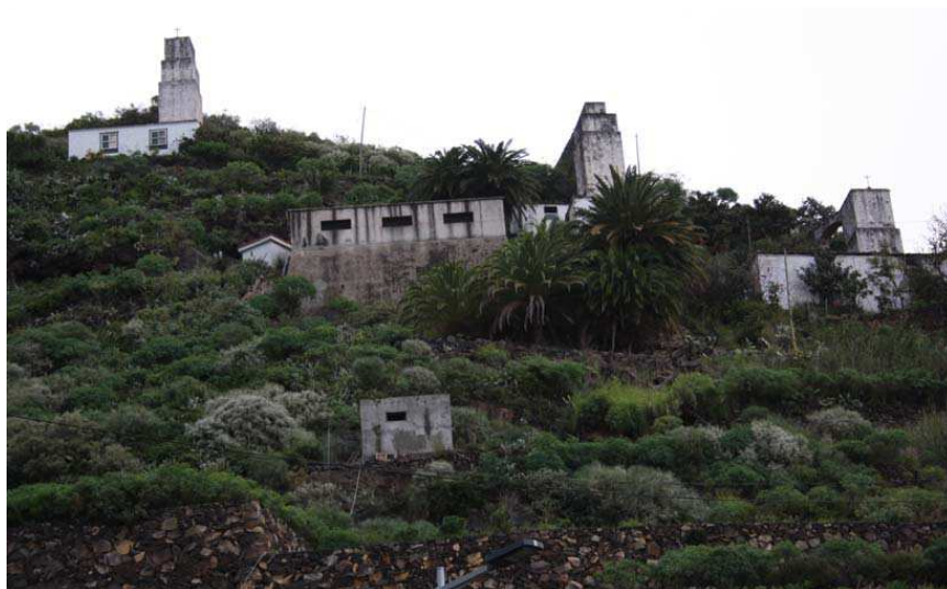
Figura 10. Molinos de Bellido (La Palma)

Al margen del uso fraudulento del agua (cajitas no ajustadas a la medida, orificios manipulados, etc.), uno de los problemas que mayor discrepancia ocasionaba era la medida de los radios de los círculos del patrón, e incluso cuando una comisión los halló, como la mayoría eran cantidades irracionales, a la hora de su aplicación práctica surgía el desacuerdo.