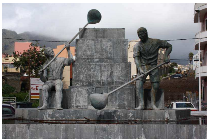
Figura 8. Monumento al calabazo (La Palma)

Los términos almud, arroba, vara y calabazo [de primer nivel (16 l), calabazo de segundo nivel (14 l) y calabazo de tercer nivel (12 l)] cada vez se oyen menos (Figura 8).