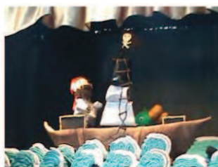
Figura 1: El pirata Barbasucia y su Perico en búsqueda de un tesoro

El argumento central de la obra El pirata Barbasucia , gira alrededor de la búsqueda de un tesoro que les obliga a cruzar mares y océanos guiados por pistas que encuentran en cada isla a la que llegan. El mapa es el mediador del diálogo con los pequeños ya que el pirata Barbasucia y su compañero Perico, solicitan apoyo a los niños para determinar el rumbo que deben seguir (ver Figura 1). La emoción, el nerviosismo, las risas y los gritos no se demoran en aflorar cuando las cortinas del teatro se abren y aparece, en un mar embravecido, al barco que transporta al Pirata Barbasucia.