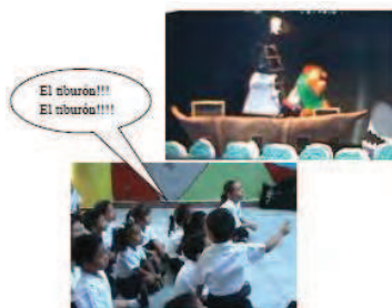
Figura 2: Entre sorpresa y nervios compartir con los compañeritos

Encontrar el mapa es el primer desafío que propone la obra, y en esa discusión aparece un tiburón. Entre sorpresa y susto, los niños comienzan a gritar que hay un tiburón formando un alboroto cada vez que la cabeza se asoma. Esta emoción tan a flor de piel de los pequeños se traduce en un zapateo nervioso en uno de los niños de tres años quien se para e intenta avisarle a todos sus compañeritos que hay un tiburón... (ver Figura 2)