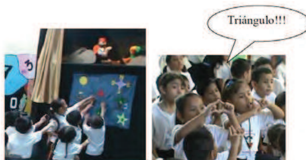
Figura 3: Pequeños indicando el triángulo con gestos distintos

El pasaje de la isla Círculo hacia la siguiente isla llamada “Triángulo”, provoca desconcierto en los más pequeños, pues asociar abajo y derecha, es decir, “sureste” fue imposible de armar como respuesta, por lo que el apoyo se redujo a gritar “ ahí... ahí ”... indicando con los brazos. Ante la exigencia del pirata que indicaran “donde”, los niños optan por salir corriendo para indicar en el mapa, con sus deditos, el lugar donde estaba la isla... (ver Figura 3).